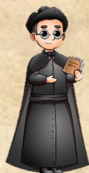
Ilustración Senderos ediciones